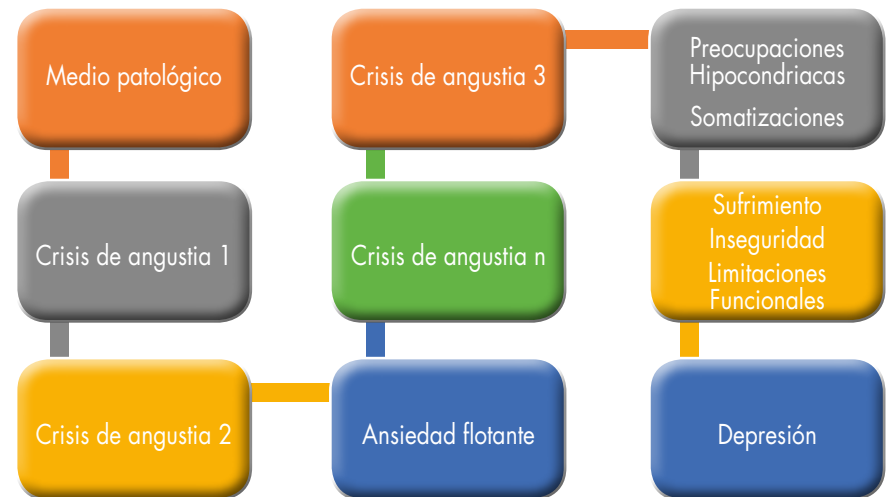
Figura 1. Evolución de la agorafobia.